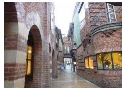
貝特赫街 Böttcher Str

所屬聯邦州 : 不萊梅州 海拔高度 : 11.5米 面積 : 325.42平方千米 人口 : 547,765 (2007年3月1日) 人口密度 : 1683人/平方千米 郵政編碼 : 28001 - 28779 電話區號 : 0421 汽車牌號 : HB 政府網站 : www.bremen.de