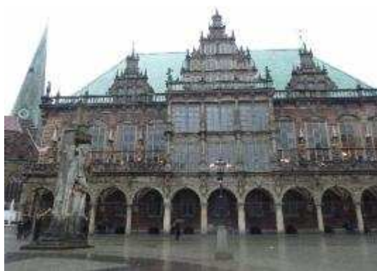
市集廣場上之舊市政廳 City Hall