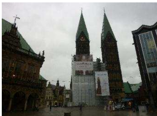
聖彼得大教堂 St Petri Dom 建於1042年